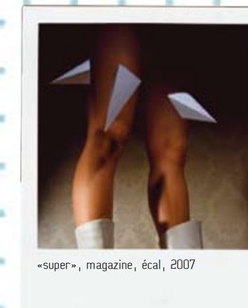
«super», magazine, écal, 2007