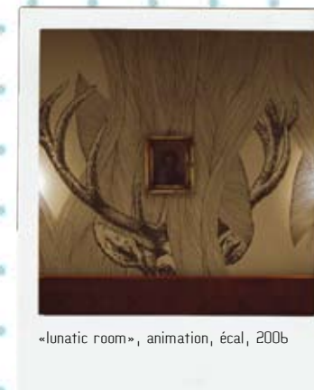
«lunatic room», animation, écal, 2006