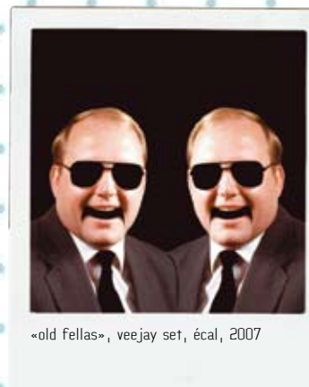
«old fellas», veejay set, écal, 2007