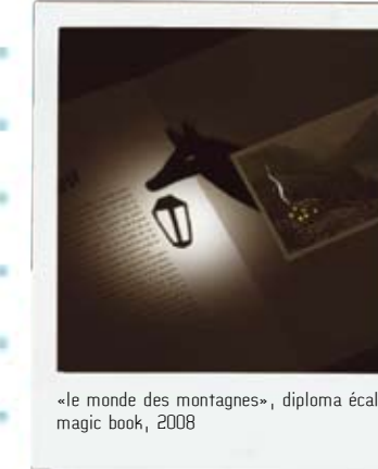
«le monde des montagnes», diploma écal, magic book, 2008